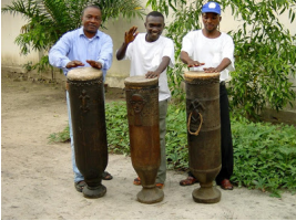
Τύμπανα ταμ ταμ

Είναι κυνηγοί και τροφосуλλέκτες. Επικοινωνούν με τα τύμπανα τους και σε πολύ μακρινές αποστάσεις.